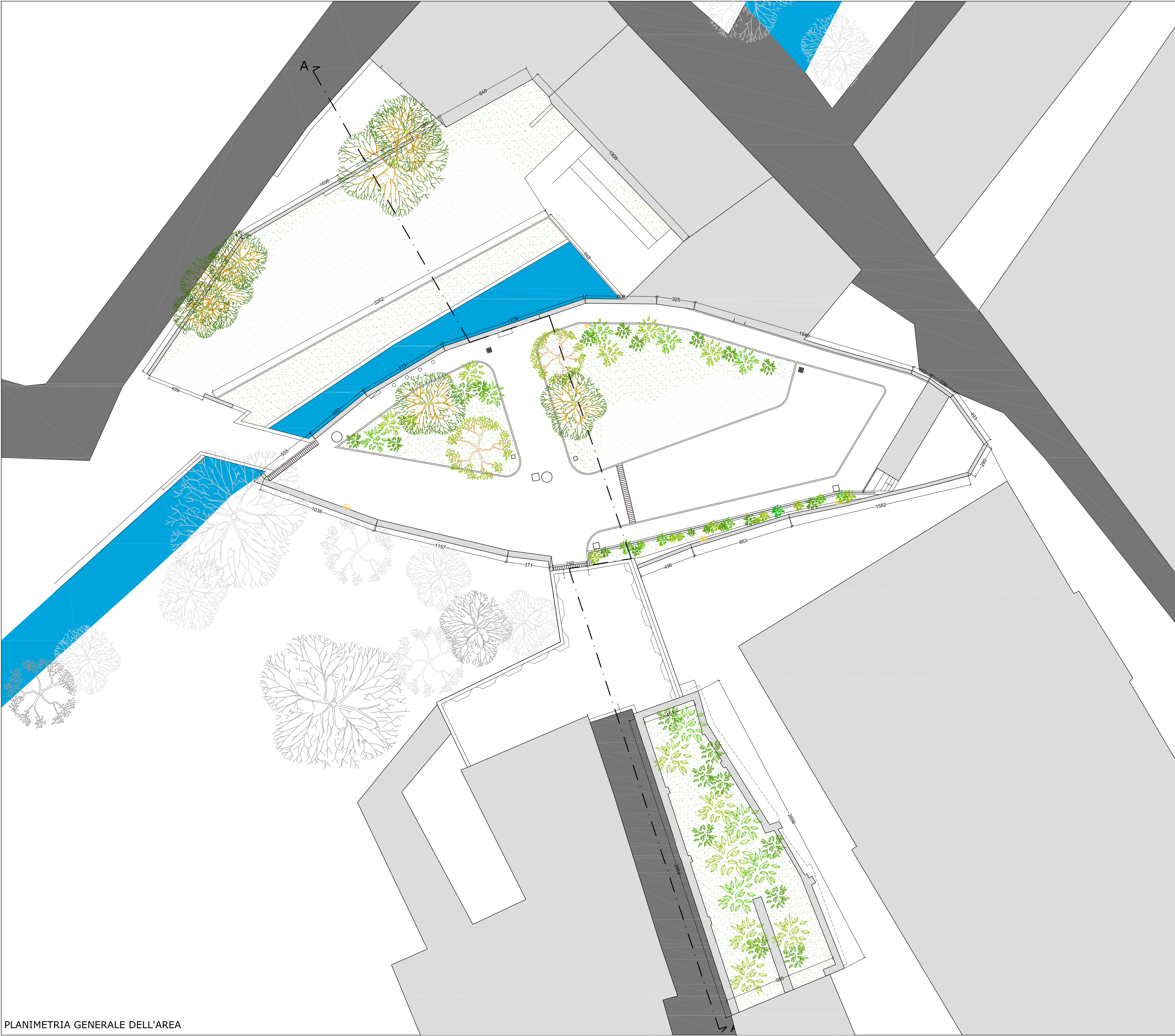
PLANIMETRIA GENERALE DELL'AREA